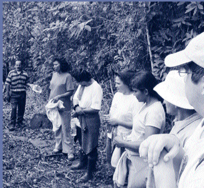
La imagen refleja el trabajo de las comunidades y el intercambio de experiencias con respecto al turismo rural comunitario.

Hoy, es una realidad el acceso a este producto, del cual podremos generar dividendos económicos por medio de nuestra Oficina Promotora de Turismo Rural Comunitario, apoyar a nuestros proyectos rurales e invertir en la implementación de nuestros objetivos institucionales.