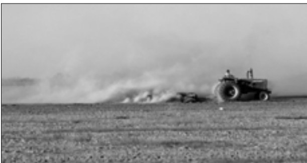
Figura 6. La agricultura intensiva a lo largo del Golfo de California, México, está provocando una seria erosión de los suelos en algunas zonas.

El uso de terrazas, o "cinturones de protección" y otras medidas para reducir la erosión hídrica o eólica pueden