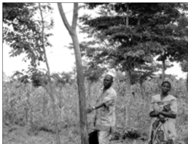
Figura 7. Árboles restaurados en la región Shinyangar, Tanzania.

dudas en cuanto a derechos de propiedad sobre los árboles y el uso de tierras privadas. Ya se encuentran implantadas formas de agrosilvicultura más sofisticadas y específicas para determinados sitios, lo cual brinda nuevos incentivos que posiblemente logren vencer esta resistencia.