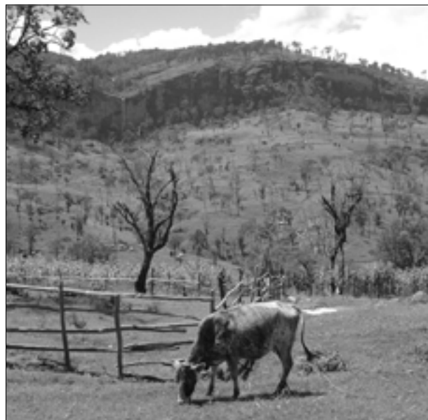
Figura 9. Orilla de Parque Nacional Mt. Elgon, con antiguos árboles dejados en tierras agrícolas.

algunos casos, las políticas impiden la participación de la gente local en el manejo de los recursos naturales. El proyecto de reforestación en Uganda que se describe en el Recuadro 7 demuestra las consecuencias de hacer caso omiso a los intereses de la gente local.