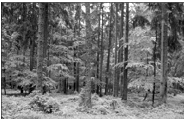
Figura 3. Bosque mixto a lo largo de la Zona del Sendero Dorado, la ruta de transporte de sal desde Alemania a la actual República Checa.

Las implicaciones sociales de las actividades de forestación y reforestación tenderán a ser cada vez más prominentes en los países en vías de desarrollo. Una de las preocupaciones primordiales es que el cambio del uso de la tierra, tal como se requiere para el desarrollo, será más flexible bajo los contratos de carbono. Además, para muchas comunidades, la antigua forma de uso de la tierra (por ejemplo, la ganadería vacuna) podría proporcionar ingresos mayores. Además, para muchas comunidades, la anterior forma de uso de la tierra (por ejemplo, la ganadería) podría