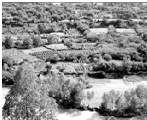
Figura 10. Agrosilvicultura en las Montañas Atlas, Marruecos, John Newby, fotógrafo, WWF-Canon.

fortalecimiento de las instituciones locales, generen ingresos para las comunidades que dependen del bosque o que realcen la biodiversidad forestal. Hay que hacer un análisis para determinar quiénes se benefician de los proyectos y cómo se distribuyen dichos beneficios. Los proyectos MDL no garantizan, necesariamente, las mejoras sociales, económicas o ambientales.