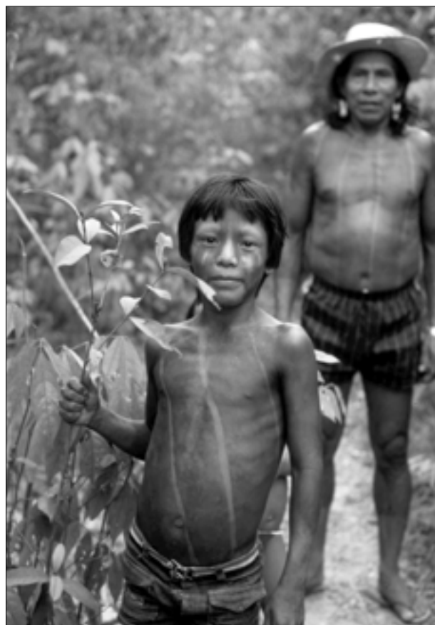
Figura 1. Dos indígenas kayapo en un sendero bordeado por plantas medicinales en el bosque lluvioso, Parque Nacional Amazonia de Parà, Brasil.

Las Partes de la CMNUCC se orientan según el principio de que las actividades forestales y de uso de la tierra deben contribuir a la conservación de la biodiversidad y el uso sostenible de los recursos naturales. 3 Asimismo, se les pide cumplir con sus compromisos bajo la Convención de la Diversidad Biológica (CDB) y otros convenios internacionales que rigen sobre el medio ambiente relacionados con el manejo sostenible de bosques y la agricultura. 4 Además, se espera que minimicen la degradación ambiental que resulta de actividades forestales y de uso de la tierra, mediante el empleo de estrategias tales como valoraciones de impactos. 5 UICN – La Unión Mundial para la Naturaleza y el Programa de Naciones Unidas para el Medio Ambiente (PNUMA) han expresado un fuerte apoyo a las actividades forestales y uso de la tierra administradas bajo el Protocolo de Kyoto, que sean ambientalmente y socialmente equitativas. 6