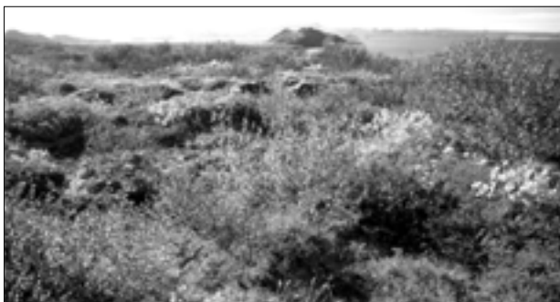
Figura 4. Paisaje Original de arbustos en el suroeste de Islandia.

En el contexto del Protocolo de Kyoto, la deforestación incluye actividades que se iniciaron a partir del 1º de enero de 1990 y que redundarán en un débito en la cuenta del