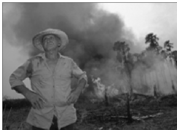
Figura 5. Un agricultor campesino prende fuego a un bosque de su terreno como preparación para la siembra. Roraima, Brasil.

Se ha aducido que la intensificación agrícola puede beneficiar la biodiversidad en algunos entornos al reducir la demanda para la tierra agrícola en otras partes. Otros señalan, sin embargo, que resulta muy difícil hacer una determinación del beneficio asociado para la biodiversidad derivado de prácticas de la intensificación agrícola debido a la gran diversidad de factores que impulsan el uso de la tierra y el cambio en el uso de la tierra. Estrategias para incrementar la biomasa mediante la intensificación agrícola deben ser planeadas y ejecutadas con muchísima atención a las condiciones locales y deben apuntar a las zonas apropiadas. La agricultura orgánica y otros sistemas agrícolas que apoyan la biodiversidad podrían servir como guía (Federación Europea de Conservación Agrícola, 1999).