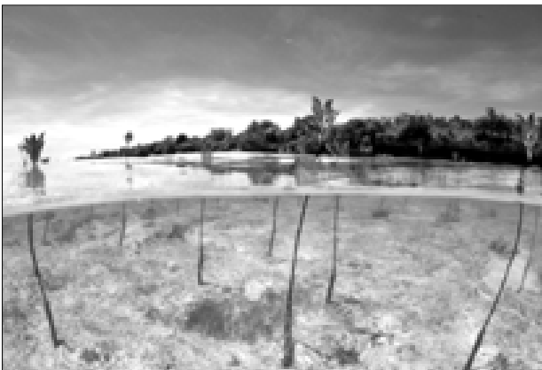
Figura 8. Reforestación de manglares, Filipinas, Jürgen Freund, fotógrafo, WWW-Canon.

El Recuadro 5 describió cómo se emplea la agrosilvicultura en México para estimular el secuestro de carbono. Proyectos en Nigeria, Cabo Verde y Ghana, incluidos en el banco de datos de mejores prácticas desarrolladas por PNUMA en el Centro Mundial de Agrosilvicultura (ICRAF), y también demuestran cómo puede servir la agrosilvicultura para controlar la degradación de la tierra y reducir la pobreza.