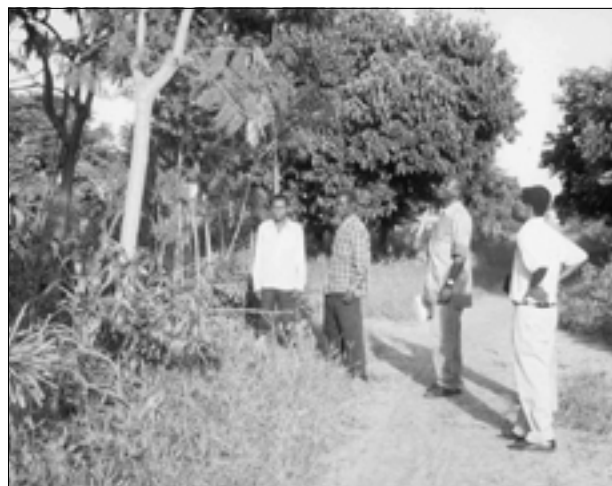
Figura 11. Bosque restaurado ngitili en la región de Shinyanga, Tanzania.

Los gobiernos pueden hacer uso de varias iniciativas para facilitar las actividades forestales y de uso de la tierra que contribuyan a la mitigación del cambio climático. Por ejemplo, los gobiernos pueden integrar nuevos proyectos con programas nacionales de desarrollo sostenible creados como parte del proceso de la Agenda 21. Además, casi todos los gobiernos signatarios de la CMNUCC lo son también de la CBD, y éstos han preparado Planes de Acción de Biodiversidad Nacional. Muchos de los principios del enfoque ecosistémico aprobado por la CBD fácilmente pueden aplicarse a los proyectos y actividades forestales y de uso de la tierra. Tanto el programa de trabajo para la biodiversidad forestal expandido por la CBD como los principios para la mitigación del impacto de especies ajenas e invasivas sirven para brindar orientación adicional. El Programa Mundial de Especies Invasivas, alianza entre gobiernos, organizaciones intergubernamentales, las ONG,