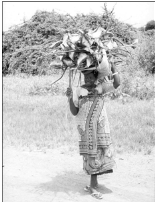
Figura 12. Se recolectan productos no madereros de bosques restaurados (ngitili) en la región Shinyanga, Tanzania.

desarrollar algunas medidas preventivas que identifican a los grupos sociales y ambientes naturales vulnerables e indican las medidas que les afectan.