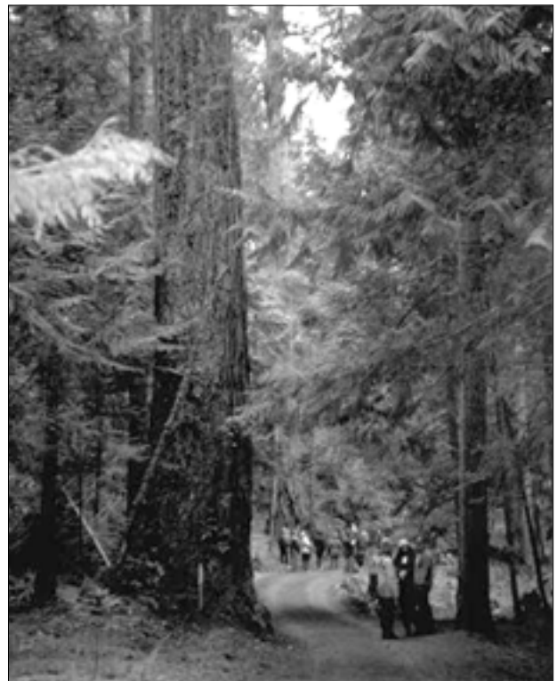
Figura 13. Actividades forestales y de uso de la tierra puede contribuir al logro de reducciones en emisiones de gases de efecto invernadero, a la vez de brindar oportunidades para mejorar tanto las condiciones ambientales como sociales.

Las medidas preventivas sociales y ambientales, incluyendo medidas contra las especies ajenas e invasivas, pueden garantizar que el nuevo incentivo en pro del secuestro de carbono no abruma las actuales prioridades del manejo ambiental, la generación de ingresos y el alivio de la pobreza. Las consultas a los afectados deben llevarse a cabo para recoger información y lograr la aceptación del público para las nuevas iniciativas en forma de políticas. Otra política valiosa para garantizar que las actividades forestales y de uso de la tierra sean ambientalmente sanas y socialmente equitativas es un régimen para monitorear y evaluar los efectos socioeconómicos de los proyectos de secuestro de carbono.