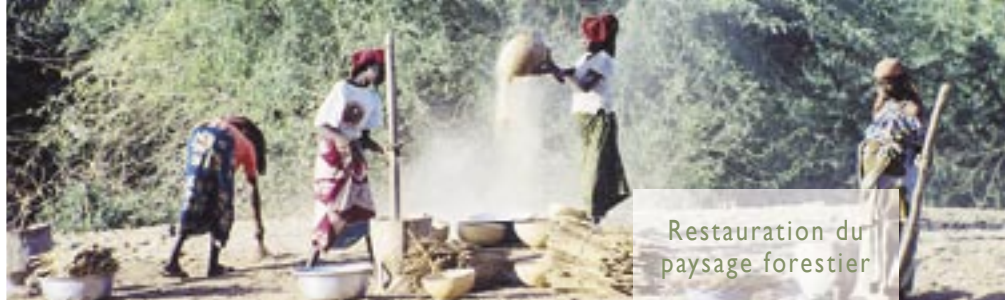
Restauration du paysage forestier